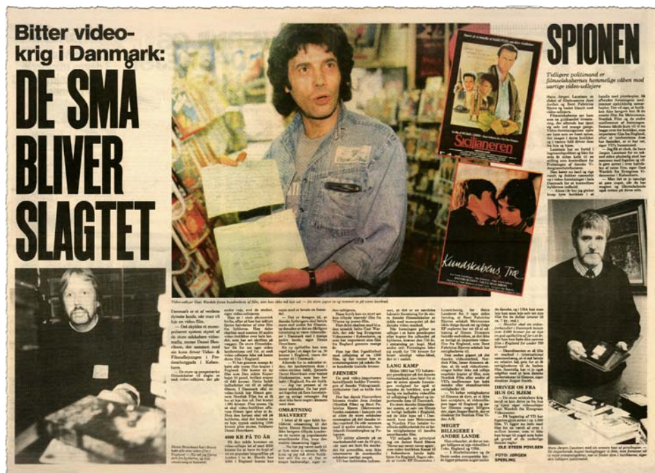
Ekstra Bladet, 9. oktober 1988

filmen. Dommen fastslår endvidere, at det ikke er lovligt at importere videofilm fra England, som Bent Fabricius-Bjerres selskaber har rettighederne til.”