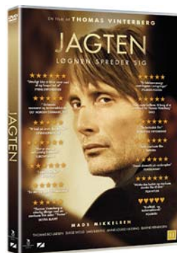
Ikke et kunstværk