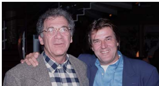
Sydney Pollack og Jeroen Krabbé