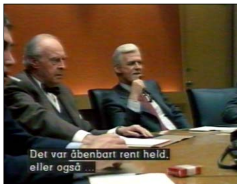
Pan&scan-versionen på VHS