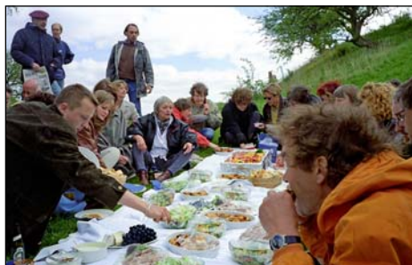
Nils Vests billeder fra filminstruktørernes picnic på Kalø, 13. maj 1995