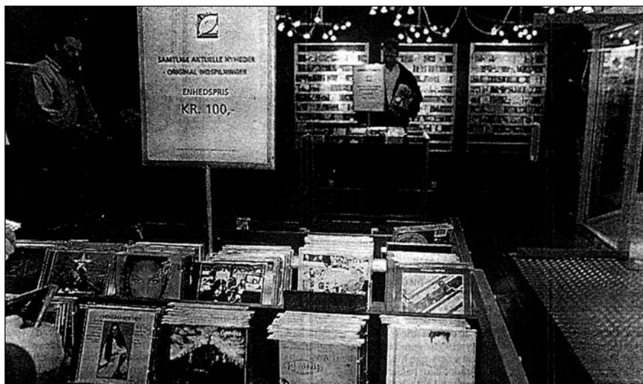
Enhedsprisen på 100 kroner hos One Stop har fået pladeselskaberne til at sige Stop - de truer med retssag.