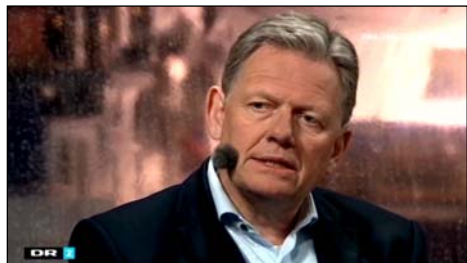
danskjultekorrupsion.dk/video42 Lars Barfoed, 17. juni 2017