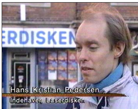
danskjultekorrupsion.dk/video44 TV Aalborg, 28. oktober 1994