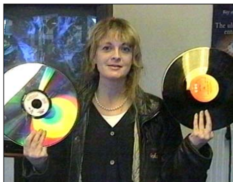
danskjultekorrupsion.dk/video43 TV Aalborg, 24. oktober 1994

Jeg var rolig, men bestemt, og på baggrund af Børsens artikel håbede jeg, at de forstod, at det ikke var tomme trusler. Jeg ved ikke, hvad der gjorde udslaget, men dagen efter afgjorde Momsnævnet uden yderligere forklaring, at LaserDiscs ikke var omfattet af afgiftspligten. Lov om forbrugsbegrænsende foranstaltninger blev ophævet allerede året efter, og i 1997 blev Momsnævnet nedlagt.