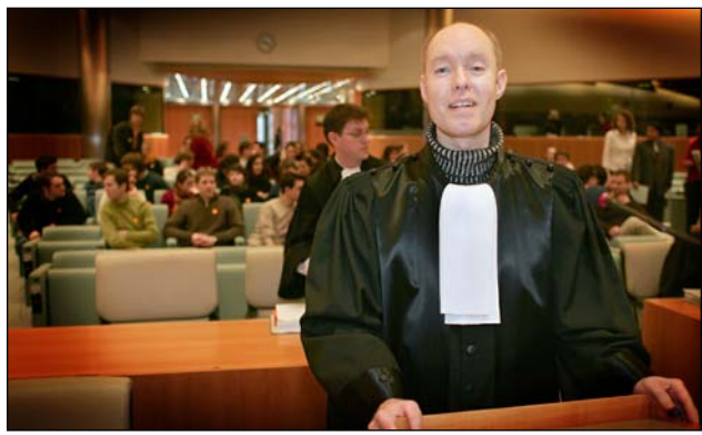
synspunkter med den nordjyske importør, men regeringen var ikke personligt repræsenteret ved retssagen. Derfor var Hans Kristian Pedersen uldg afgørende for om domstolen ville finde

Den polske regering havde i et brev til domstolen meddelt, at den delte flere